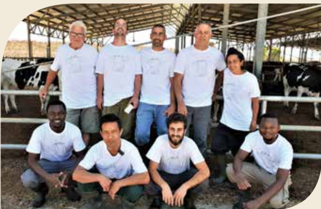
הכי קרובים לגבול. צוות רפת נחל עוז

רפת נחל עוז, כ-400 חולבות, מכסה של 4.3 מיליון ליטר לשנה, 9 עובדים, מרכז מזון עצמאי, חלב לתנובה. מתכוונים בשנה הקרובה להשקיע בבניית מכון חדש, ממתנים להיתר בניה. מכון של צח"מ פרלל 20 על 20. שנה מהיום מקווה גידי, נוזמן לחנוכת המכון החדש. בהצלחה!