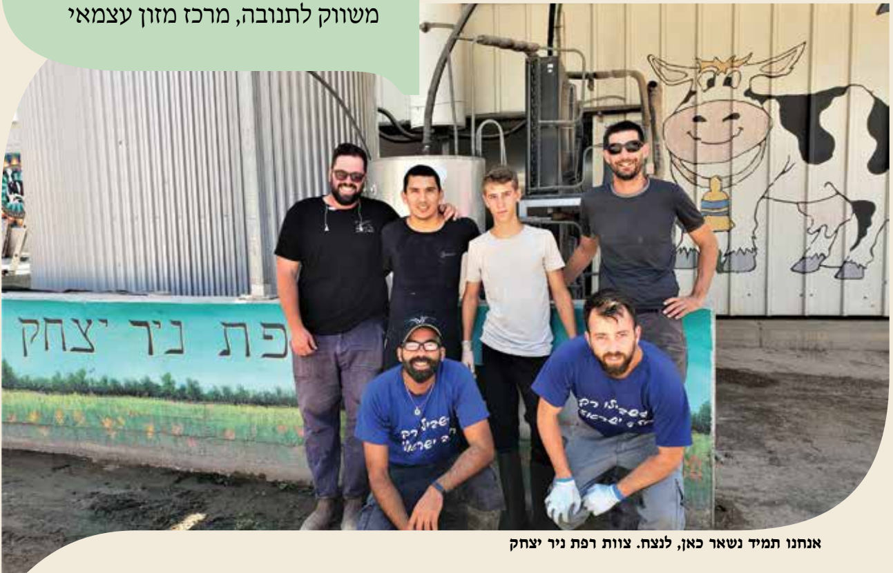
אנחנו תמיד נשאר כאן, לנצח. צוות רפת ניר יצחק

מכסה של 7 וחצי מיליון ליטר, רפת משותפת של קיבוצים ניר יצחק וסופה, 550 חולבות, חלב מהדרין משווק לתנובה, מרכז מזון עצמאי