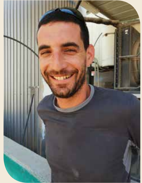
הגיע הזמן לשינוי. בלברמן ג'וניור

"תשמע, אני עושה מה שאומרים לי, אני בעד שוק חופשי ולדעתי צריך שינוי בכל הליך התכנון, צריך לתכנן רגולציה מול הממשלה אך חלב תמיד ישתו. הקסמים יותר מעצבנים אותי, ואף אחד לא פותר את העניין. לדעתי צריך להעביר את כל החקלאות לפריפריה, זה יפתור את הבעיה. החקלאות חייבת