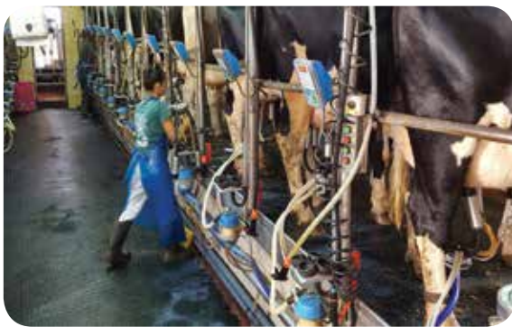
תנובת חלב מהגבוהות בעולם. הרפת הישראלית

כמה חלב הישראלי צורך במוצעי? כמה חלב רפת אחת מפיקה? מן הנתונים עולה כי בשבוע שחל בו חג שבועות, חלה עלייה ב-53% בצריכת מוצרי חלב ותחליפיו וכ-84% של בצריכת מוצרים במעדנייה החלבית. המוצרים הכוכבים של החג, גבינה לבנה ושמנת מתוקה •