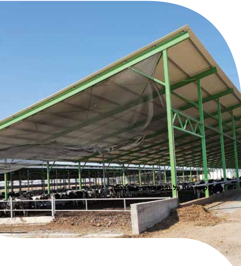
התקנת מערכת מינימום מים