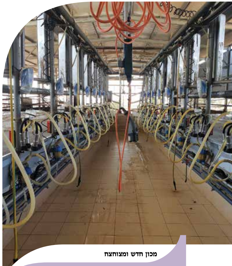
מכון חדש וממוצח

ההתעסקות היום יומית והתחום המשפיע ביותר על כמות ואיכות החלב.