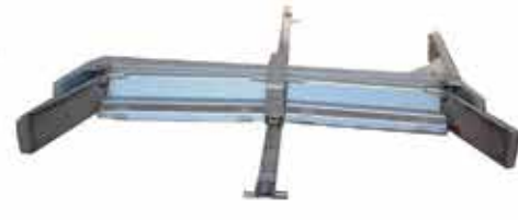
גורף זבל נגרר ע"י חבל