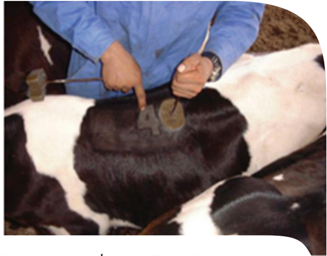
בחנית סממני כאב ועקה בעת ולאחר סימון בחום, בקור ובדמה

עם אפקט מתמשך למספר ימים. גם קרפריב (קרפרופן) ניתן חד פעמי ויש לו אפקט מתמשך של שלושה ימים ולכן הוא מתאים כנוגד דלקת.