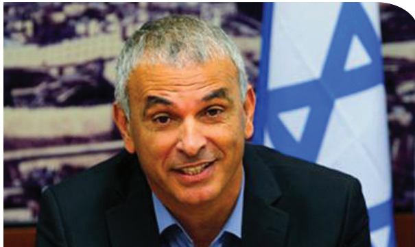
לא על היבוא לבדו מר כחלון

מר אריאל ומר כחלון, שרים נכבדים, כשאתם יושבים לשולחן הפסח ומדברים ביציאת מצרים, תזכרו את כי העבדות לא נעלמה מהעולם והמושג בני חורין הוא מתעתע לפחות כמו כיסא בממשלה. כשאתם מחכים לאליהו הנביא תזכרו את החקלאים ותדעו כי לא רק באגדות מתחשבים עם השלטון. כשאתם יושבים לשולחן הפסח ושרים די דיי דינו, תזכרו את החקלאים, כי הם בטוח לא ישכחו אתכם. די דיי דינו