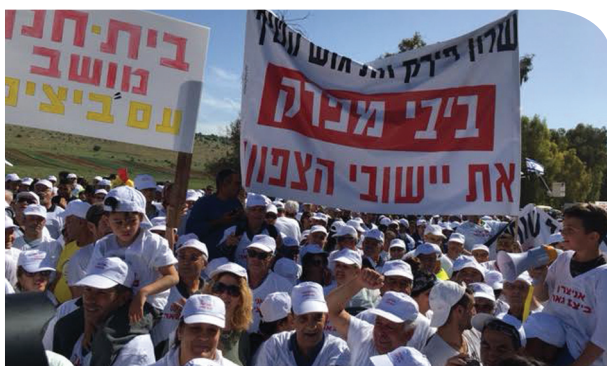
הפגנת החקלאים בצפון. נאבקים על הפרנסה.

ידיכם אתם פוגעים, הורסים וגורמים לקריסת הענף אולי האחרון במדינה שיש בו עדיין אנשי עמל ועבודה. הסיבה שלכם, יוקר המחיה, אך גם אתם יודעים שאתם מכוונים למטרה הלא נכונה. החקלאים בקושי רב מתפרנסים והבעיה העיקרית הינה המונופולים בשוק המזון ופערי התיווך הבלתי נתפסים בין החקלאי ועד המוצר במדף בחנות. אך אתם, שרי החקלאות והאוצר, לא תתעסקו בחזקים, אלא הכי קל להיטפל לחלשים, כרגיל, לחקלאים, לרפתנים, ללולנים, לאנשי האדמה המעבדים את שדותיהם בזיעת אפם. די דיי דיינו