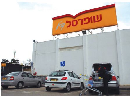
מה הדיל, שופרסל??

יממה לאחר פרסום הידיעה, רשת השופרסל תחזיר ללקוחותיה את ההזולות שקיבלה מהיצרנים על מוצרי חלב. רשת יינות ביתן, שגם שמרה לעצמה את ההזולות: "צרכני הרשת מקבלים לאורך כל השנה את המחיר הממוצע הנמוך ביותר למוצרי החלב". שופרסל תחזיר את הסכום, 123 אלף שקל, באמצעות זיכוי בכרטיס המועדון של לקוחות שופרסל. ▲