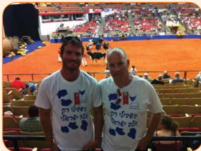
אולם התחרויות וכמובן אנחנו בגאווה ישראלית

הגענו אל העיר מדיסון אשר במדינת וויסקונסין. מדיסון היא עיר הבירה של המדינה המונה כרבע מיליון תושבים. למעשה ולאחר התייעצויות, לא טיילנו בעיר עצמה אלא הקדשנו את כל זמננו (יומיים) לביקור בתערוכה. הכניסה היעילה לחנייה, הגודל העצום של מרחבי התערוכה והעושר של הצבעים, האנשים והמראות- באמריקה כמו באמריקה, גם תערוכת בקר לחלב צריכה להיות ענקית. ובמקום להכביר במילים, אתן לתמונות לספר את שראינו: