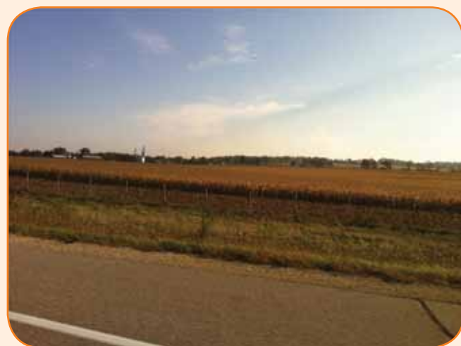
בצורת קשה בארה"ב