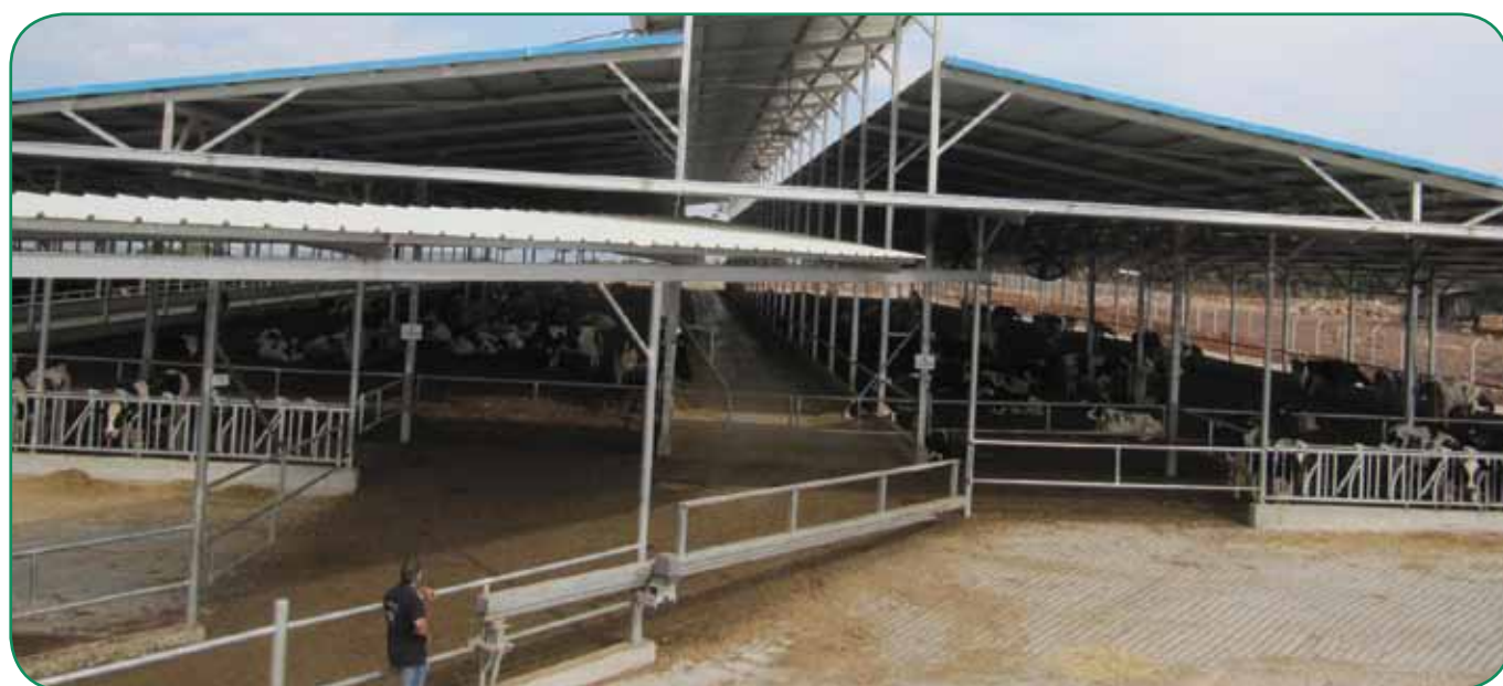
רפת מרחבית כפתרון מיטבי לנושאי הזבל

מעבר לצמצום מוקדי הזיהום ולהסדרתם, חל שיפור ניכר בכמות השפכים המיועדים לסילוק ובאיכותם. גם יעד הסילוק של השפכים שמייצר הענף השתנה, מהסביבה הקרובה (הוואדי) למערכות הביוב האזוריות והמשקיות. כמות השפכים שתורמת פרה חולבת הצטמצמה מ-250 ליטר ליום בממוצע ברפת שיתופית (בקיבוצים) ומ-100 ליטר ליום ברפת משפחתית (במושבים), ל-80 ליטר ליום. אם לפני הרפורמה ייצר ענף הרפתות כ-7 מיליון מ"ק שפכים שכ-80% מהם הוזרמו לוואדיות הקרובים, הרי שעם השלמת הרפורמה ירדה כמות השפכים ל-4 מיליון מ"ק, שרק חלק זניח ממנה עדיין מוזרם לסביבה הסמוכה.