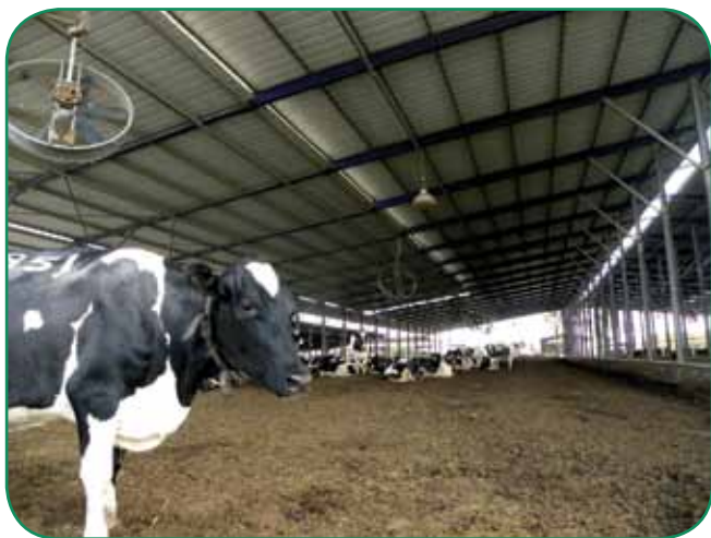
רפת מוסדרת שגם שומרת על רווחת בעלי החיים