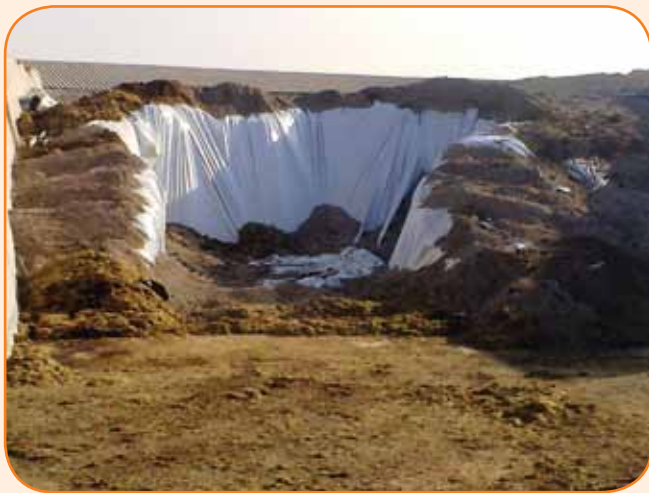
בור התחמיץ ספג מסמרים ורסיסים - מה יגיע לכרס הפרה?

בשעות הבוקר של יום שבת, במהלך אוקטובר, התגלה "הרפתן" שמאיים על מחיר החלב במדינת ישראל