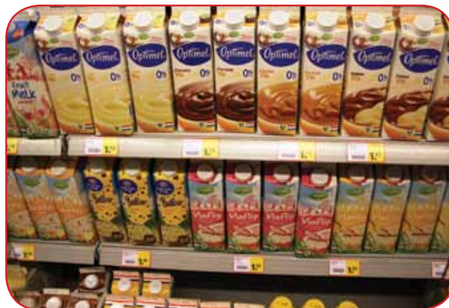
מגוון מותגים של חלב שתייה בטעמים שונים באירופה

חברות ענק נוספות הן ארלה, (Arla), קואופרטיב שבדי-דני, שבסיסו בדנמרק ומייצר בין היתר את ממרח לורפק שנמכר בישראל ופועל