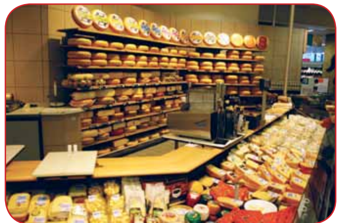
מדף חלב עשיר בגבינות קשות בהולנד

מאז, המדינה החליטה להתערב ונראה שהמחיר עומד לעלות בחזרה בקרוב, אולם נראה כי כמו בישראל, גם באוסטרליה, חלב ולא מים הוא נוזל החיים בעבור לא מעט צרכנים. מוצרי חלב זו אבן דרך בדרך לסופר, מגנט לבן שאם אתה סופרמרקט - שווה לך להפסיד בגללו מיליונים ולקחת איתך למצולות 40 רפתנים אוסטרלים שקיפלו את חוות הענק שלהם ונטשו את המקצוע.