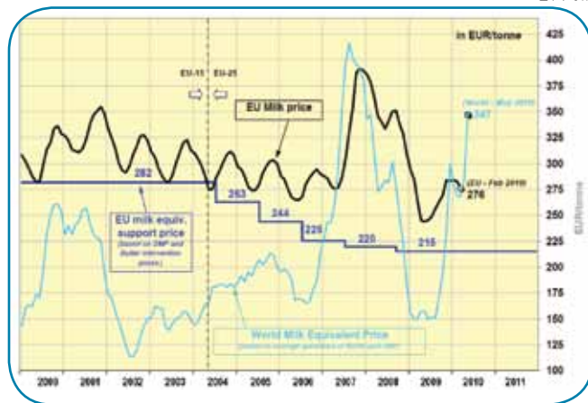
מקור: Report of the High Level Group on Milk, 15.6.2010 הגרף השחור - מחירי החלב באיחוד האירופי. הקו הכחול - מחירי ההתערבות של האיחוד. הגרף הכחול - מחיר החלב העולמי האקוויולנטי (מבוסס על מחירי חמאה ואבקת חלב)