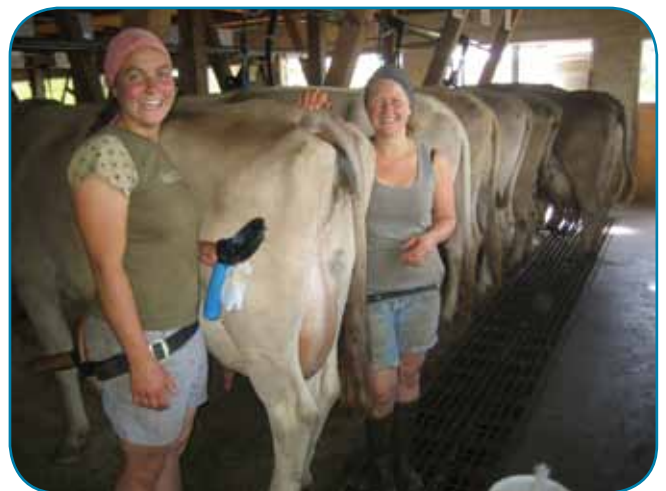
רפת חלב בשוויץ