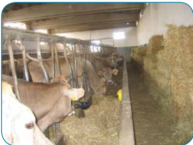
רפת בדרום איטליה