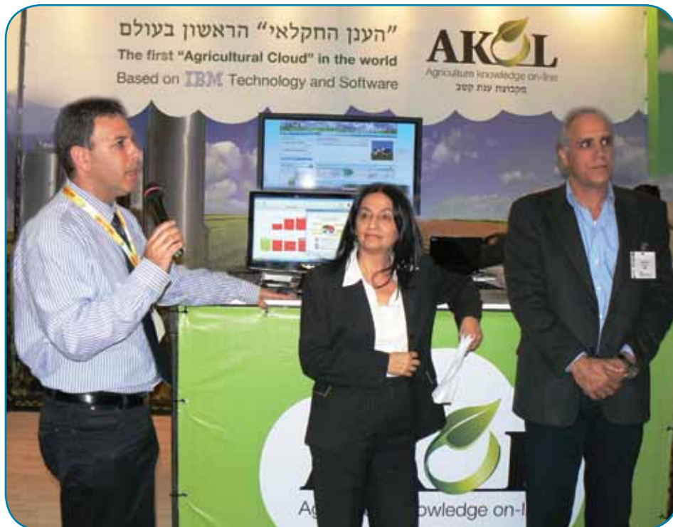
הכרזת "הענן" בתערוכת משוב - נציג IBM עם שרת החקלאות ורון המנכ"ל

■ אכן, יש פוטנציאל רחב ידיים לאקול ברור חיל וגם להתאחדות.