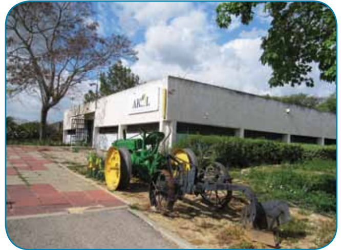
אקול - בית התכנה בקיבוץ ברור חיל