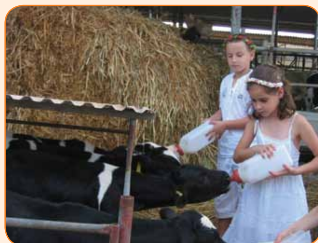
"בשביל פרות החלב" כיף להגמיע עגלות

אירוח בחצר הפנימית - לארח בתוך החצר הפרטית אינו פשוט כלל, צריך לאהוב ולהיות מוכן לווייתור על פרטיות, אנחנו אוהבים לארח ולהכיר. האורחים מגיעים, יושבים על הדשא, מחממים מים בבקבוק, עולים הביתה, מכינים מזון לתינוק והכול אצלנו בבית.