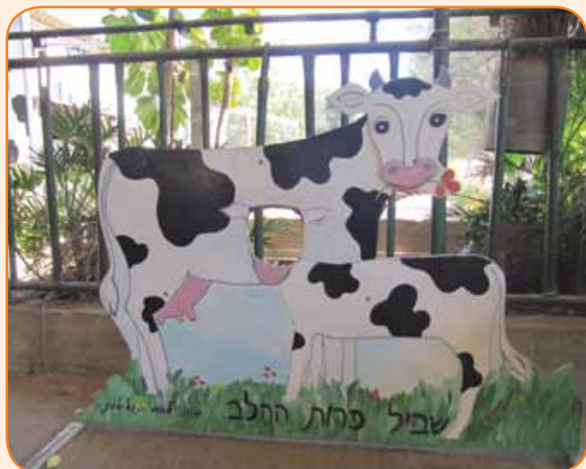
מקום להצטלם בו

החשיבה אינה ממוסחרת ולא רוצים בכך. אוהבים את האירוח האישי שאינו קר ומנוכר אלא ליווי אישי וחם.