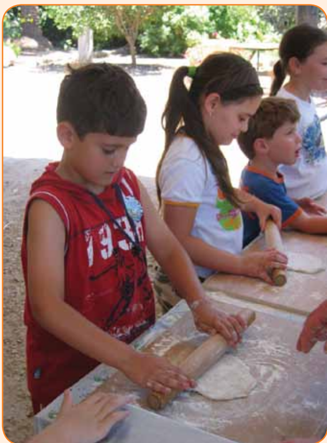
מרדדים את הבצק לפיתה עגולה

העונות החמות בתיירות: חגים, אביב, שבתות - אם אין שרב וגשם, עם ישראל רגיש למה שאומר החזאי. לא בערבי חג - למדנו מתי באים אנשים. חודשי אפריל - יוני עמוסים יותר, חג השבועות הוא זמן שיא וצריך להתארגן אליו במיוחד.