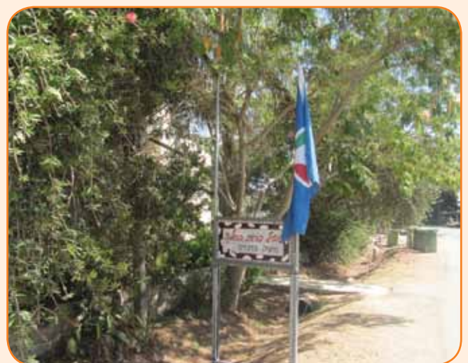
כניסה לרפת ולחנייה