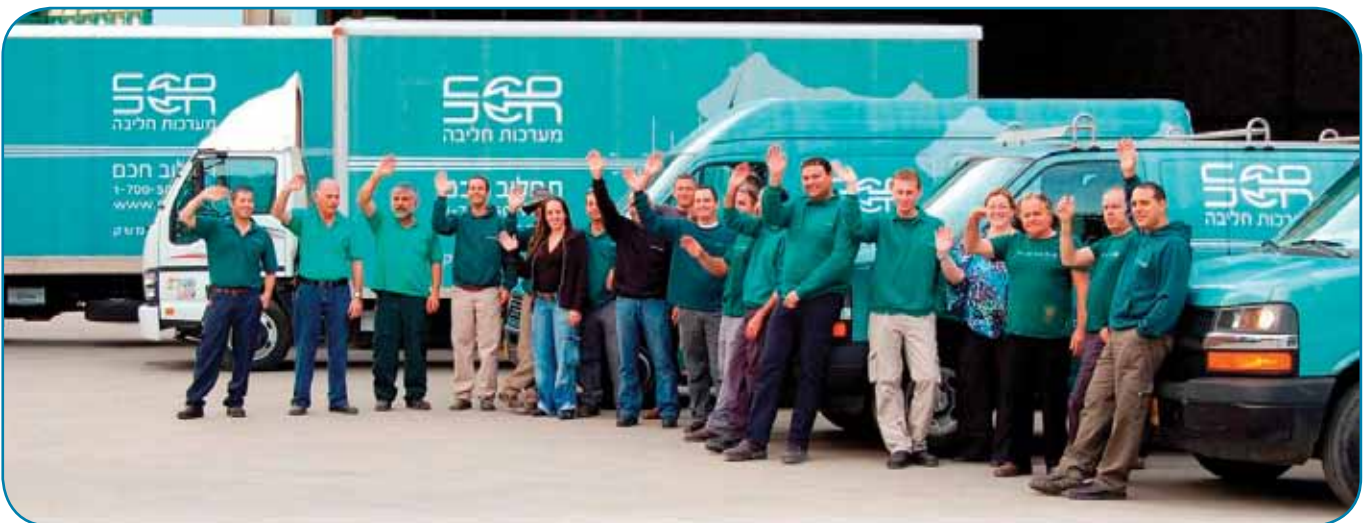
צוות החברה בתלבושת אחידה

אנחנו מאחלים לחברה הישראלית, שהייתה קטנה וכיום היא מורגשת היטב ברפת החלב בעולם, המשך פיתוח מוצרים פורצי דרך וכיבוש יעדים רבים ונוספים בעולם הרחב. ■