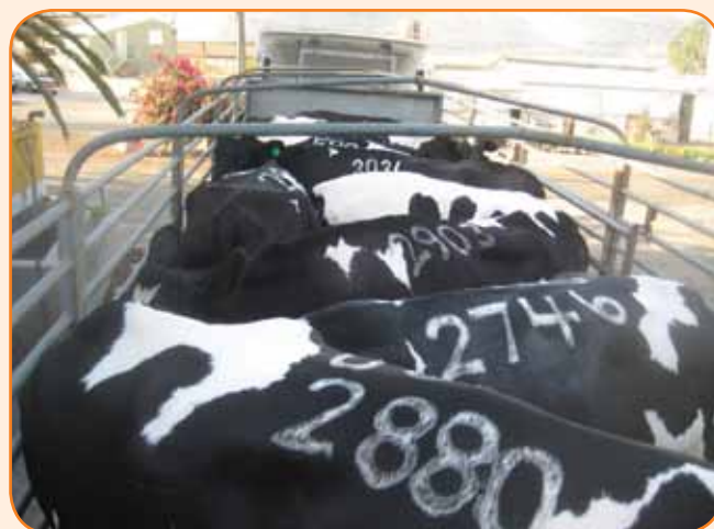
מסאית בקר בחבלה

מאחר ושוק הבשר אינו שוק מתוכנן אנו חייבים לדעת שבדרך כלל אחרי עלייה גבוהה וחדה במחיר, עלולה לבוא גם הירידה. יעשו טוב היבואנים ומגדלי העגלים המיובאים אם יחשבו פעמיים בנושא