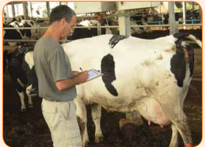
ארנון מסווג בבני בקר

ברמת המחירים ניתן לראות עלייה שנתית של 31% במחיר הפרות, עלייה שהתחילה בראשית השנה, התמתנה בחודשי הקיץ, ועלתה שוב בחודשי הסתיו.