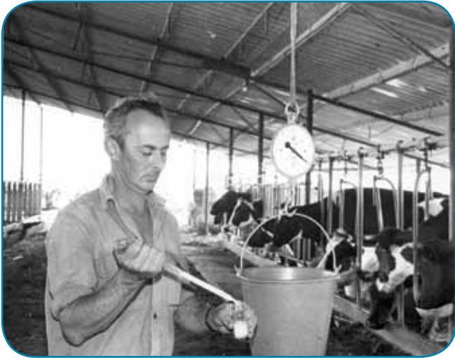
ביקורת חלב ב במשק מושבי-שקילה וזגימה שנות ה-70