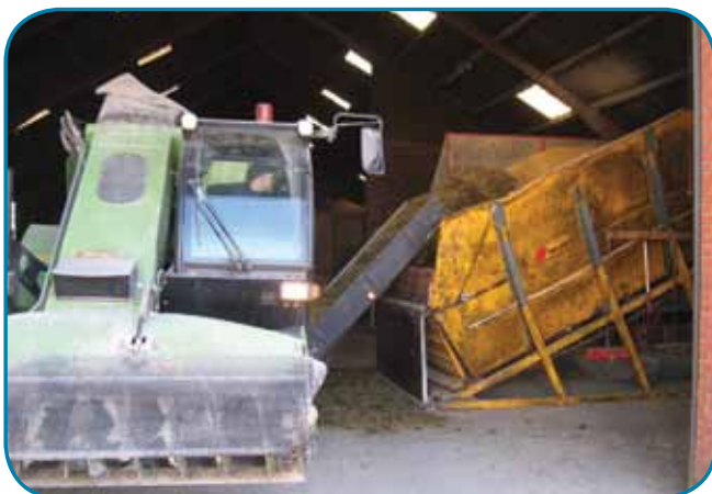
מילוי האבוס באמצעות מסוע

בהתחלה חיפשנו דרכים להחליף את אופן האבסה המקובלת ולבטל את העגלה שמחלקת מזון לאורך האבוסים המקורים. ישנם פתרונות פשוטים ומעניינים שמאפשרים להגיש לפרה אוכל טרי על גבי מסוע, בכל שעה, מתוך מכל אחסון ביניים בקצה הסככה. אבל עדיין מיקום האבוס הוא קבוע ולכן יש צורך במדרך בטון לפרות. המשכנו והגענו אל פיתוח רעיון של האבסה באבוסים ניידים. ישנם כאלה בשימוש בשדות הירוקים של אירופה (ראה תמונה) ולמה לא