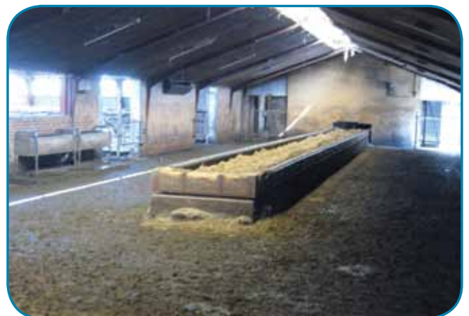
אבוס פנימי ברפת בדנמרק