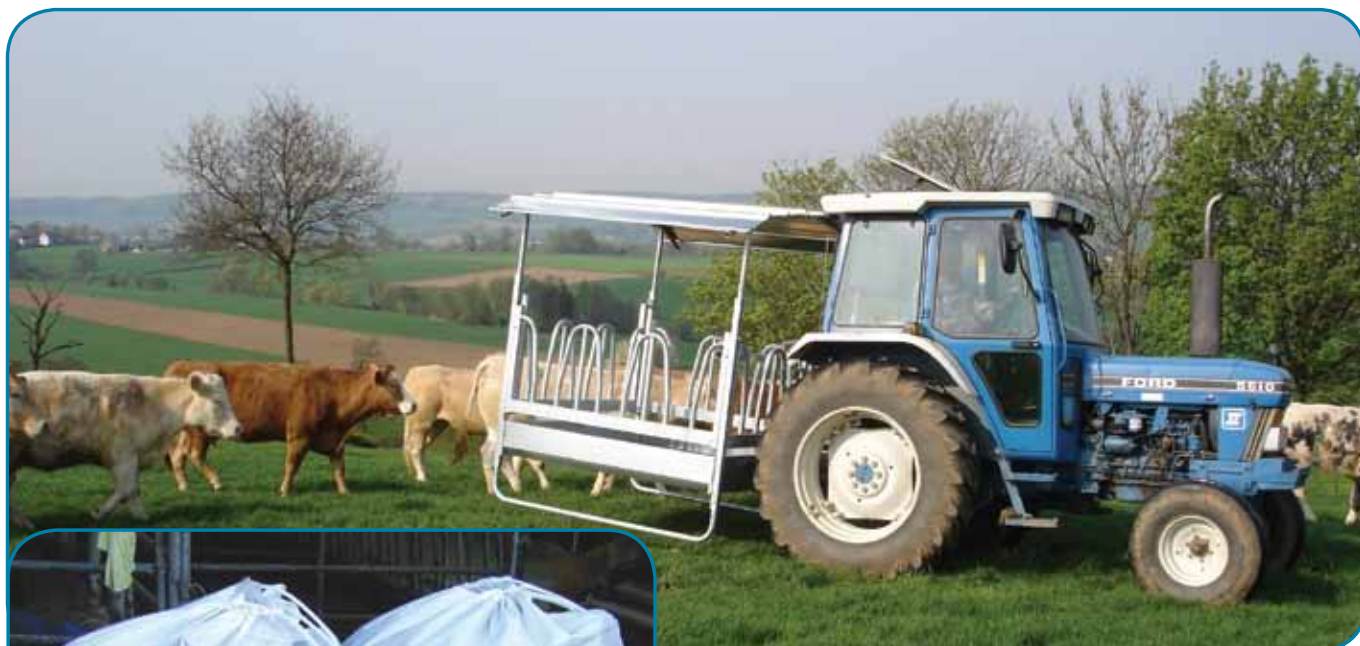
אבוס נייד בשטח