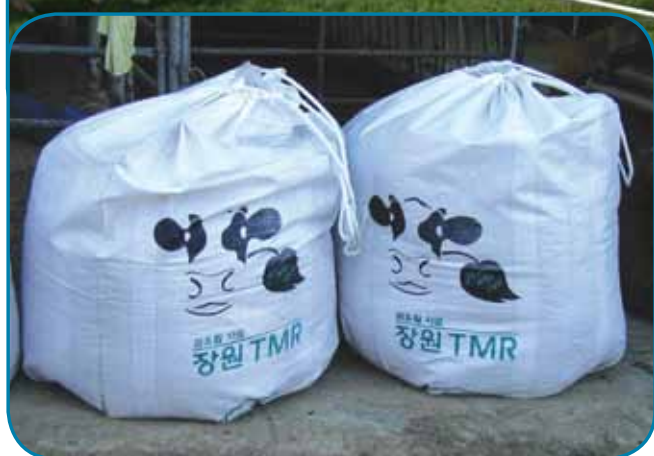
מאריזי בליל לחולבות

אולי שטח רב לפרה אבל עלות הבנייה היא רק כ-50% מעלות בניית סככה "סטנדרטית" וזה ללא התחשבנות בעובדה שלא צריך לבנות ולהפעיל מערכות לטיפול בזבל. כאן הזבל מטופל בתוך הסככה וייהפך ל"סמי קומפוסט", שהמהווה מקור הכנסה נכבד נוסף לרפת. בינתיים לומדים איך לתחזק את הסככה - הרי באירופה קשה יותר - אבל אין ספק שאנחנו בכוון אל הסככה העתידית שאחרי הסככה המרחבית.