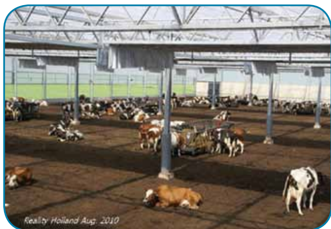
הולנד 2010 - סככה מרחבית

באוגוסט 2010 נחנכה הרפת הראשונה מדגם זה, 5,000 מ"ר חממה לשיכון 200 פרות.