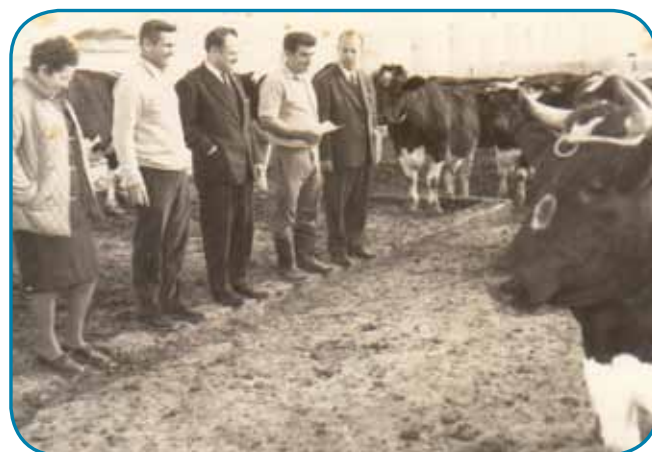
מלטה - סיור ברפת