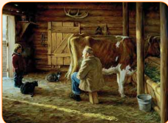
7. רפתות קטנות צפויות להיסגר - ציורו של רוברט דנקן

עלינו להפנים את השינויים שחלו בענפי החלב בעולם ולהכיר בכך שלא ניתן יהיה לחזור לשנים היציבות של העבר. השינויים האקלימיים וריבוי אירועי קיצון של גלי חום וקור, שיטפונות ובצורת ימשיכו ואף יעצימו את הצמצום בכושר הייצור העולמי של חלב. מאידך, השיפור המתמשך בכלכלת המדינות המתפתחות, בעיקר באסיה, מתבטא בעלייה בביקוש למוצרים מן החי ובהם לחלב. במידה ולא יהיה שינוי משמעותי במצב הכלכלי בעולם בכלל ובסין בפרט, צפוי שהפער הנוצר בין היצע לביקוש לחלב בעולם יוביל לשמירה על מחירים גבוהים יחסית לחומרי הגלם החלביים. התנודות התכופות במחירים עלולות לפגוע ביצרני החלב במדינות רבות בעולם, לצמצום במספרם המוחלט ולהסגרת הייצור מהיצרניות המסורתיות של חלב לייצוא (האיחוד האירופי ואוקיינייה) לחברות חדשות בתחום במזרח אירופה ובדרום אמריקה, כמו גם להגדלת הייצור אצל הצרכניות העולות כמו הודו, סין, וייטנאם ומדינות אחרות באזור. ■