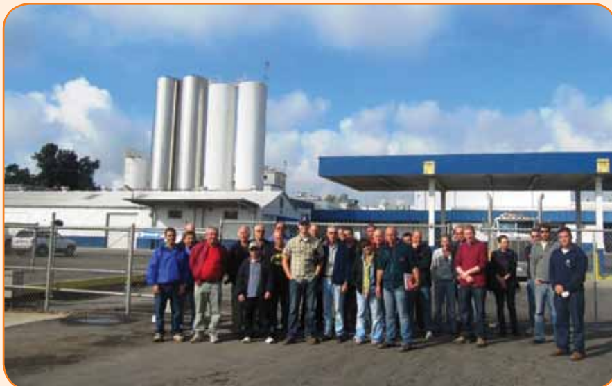
מחלבת ויסליה בקליפורניה שמייצרת אבקת חלב כשרה לישראל