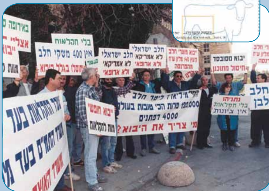
משמרת מחאה ליד משרד האוצר 2.97