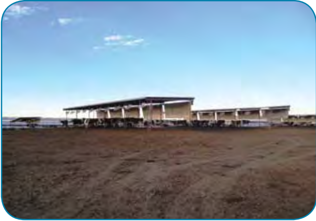
צורות ענק לאורור בשעות הערב