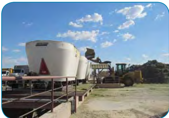
מרכז מזון נייח ברפת ענק