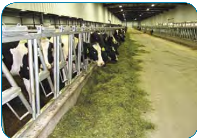
אוכל מעורר קנאה באבוס - ירוק בוהק בסככה מוקרת האקלים