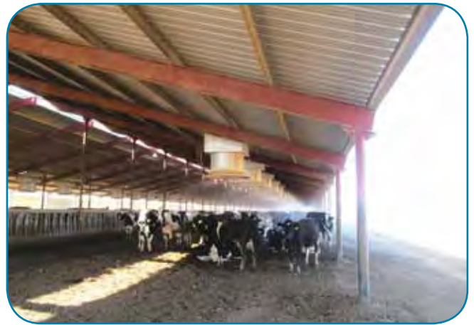
צינון מפוחים ללא סגירת המבנה - הפרות רובצות בעיקר מתחת למאזורים

המספרים היו בהערכה רחבה עם שונות גדולה בין רפתות ואזורים. הביקורים היו מטבעם, ברפתות עלית והממצאים אינם משקפים בהכרח, את כלל התמונה ברפתות בארצות הברית. בהתאם לתדריך שקיבלנו, היינו קשובים מאוד ללמוד ולהחכים - פחות ללמד אותם על מה שקורה אצלנו (התאפקנו לפעמים).