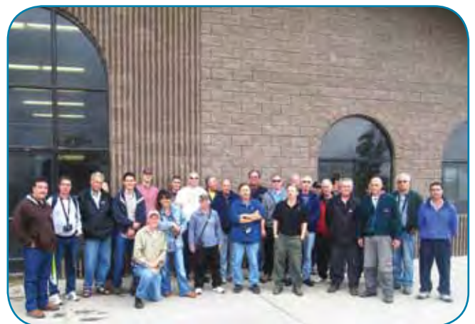
קבוצה גדולה של 28 רפתנים שנהנו מהסיור