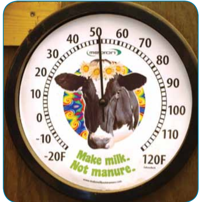
שעון קיר - "עשו חלב ולא זבל"