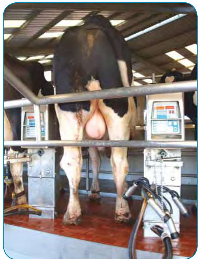
פר מעבר שגם הוא עולה על במת החליבה

4. ימי מנוחה קצרים, סינכרון ייחומים ושימוש בפר לקשות התעברות - עוד מיקוד בנושאים והתעמקות גדולה יותר, כיצד האמריקאים עושים הרבה כדי לעבר את הפרות בנוחות וביותר ביטחון.