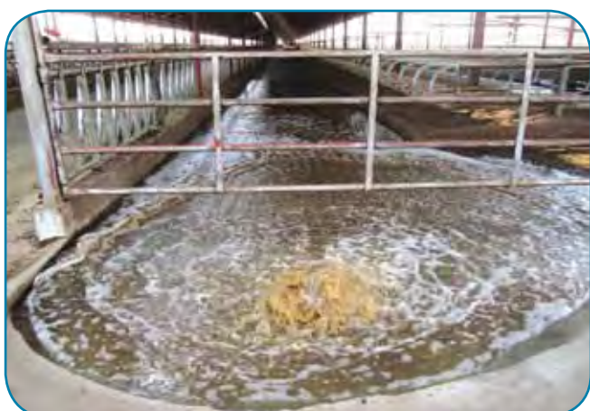
שטיפת מדרכים במים ממוחזרים - השיטה הכמעט יחידה