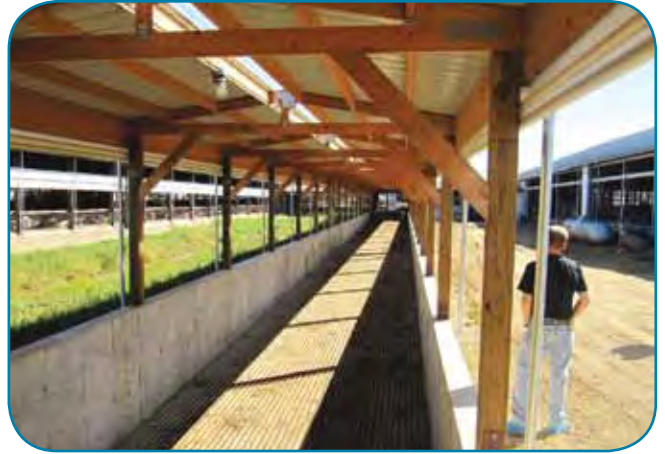
שביל הולכה מקורה להגנה על הפרות בדרך לחליבה