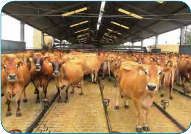
פרות מגזע ג'רסי בחליבה - שיעורן בעדר גדל בהדרגה