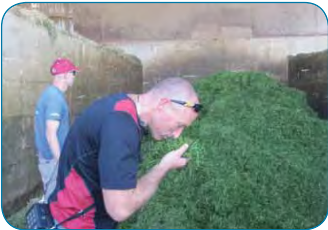
ירק טרי לשילוב במנה הכולית