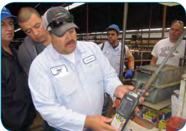
צוות הבריאות בעדר ענק עושה כמעט את כל העבודה