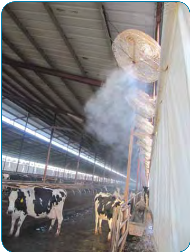
ערפול בלחץ גבוה עם וילונות לסגירת הרפת - נפוץ מאוד