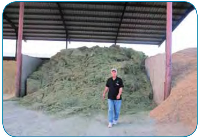
מרכז המזון עם שחת אספסת איכותית ביותר