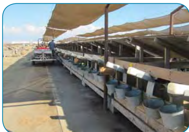
עגלים יונקים רק מבקבוקים

ק"ג חלב ליום. רכיבים ממוצעים מאוד סביב 3.2 חלבון ו-3.5 שומן, סומטיים מעל ל-200, ספירות חיידקים מעולות. 8. צינון - מודעות גדולה של הרפתנים לצורך בצינון. השקעה בסגירת המבנים ובמאווררים. שיטת הצינון המרכזית היא ערפול - מאווררים עם דיזות בצפיפות גבוהה, מעל המרבץ, וגם מעל האבוס. הפרות אוהבות להתרכז ואפילו בצפיפות גדולה. בערב הפרות יוצאות לחצר הפתוחה. ראינו גם "סככה מבוקרת" - סגורה לחלוטין עם דזרט-קולר ומאווררי ענק - נראה טוב ומפתה. 9. איכות הסביבה - הרפתנים מתלוננים על דרישות סביבה מחמירות והולכות, בפועל זה נראה הרבה פחות מהמקובל בישראל - פלשינג למדרכים, לגונות לשמירה על הנוזלים, הפרדה פשוטה ומהירה, שימוש חוזר במים לשיטה ולהשקיה, פיזור הזבל בשדות. יש גם שמפיקים אנרגיה לצרכי הרפת.