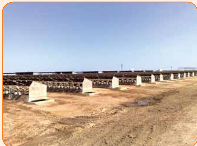
יונקיה בטקסס - העין לא רואה את הסוף...

לטכנולוגיה ולמוצרים ובעיקר על הקונספט שהחברה מובילה - לתפור לכל רפתן בדיוק את החליפה שהוא זקוק לה ומתוך הצידוד המגוון שהחברה מפתחת ומייצרת.