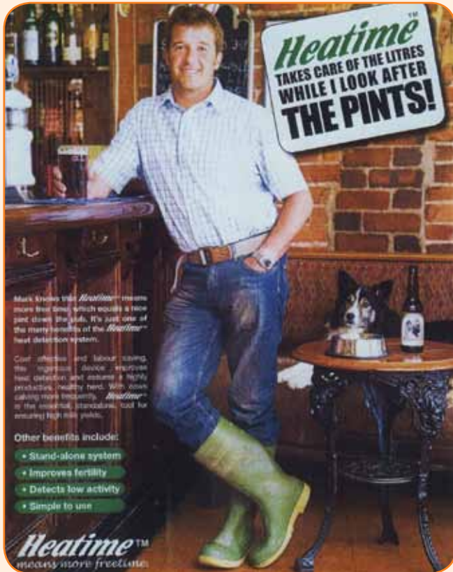
HeatimeAd: פרסומת שפונה ללב האנגלי...

לרעיונות חדשים לפיתוחים עתידיים ולשיפור המערכות הקיימות בכל הקשור לחומרה, לתכנה ובעיקר לתוכן.