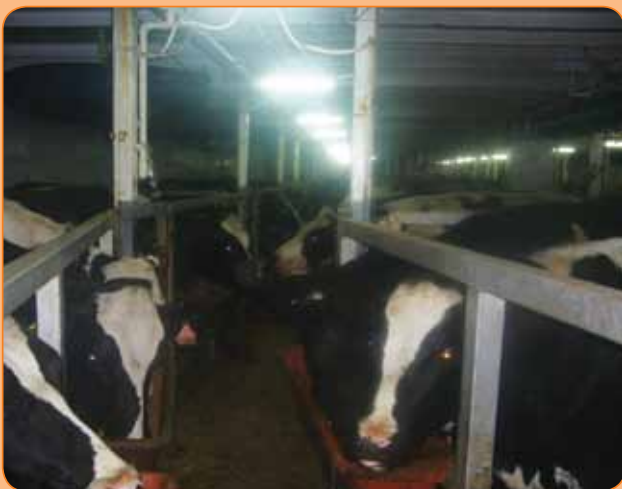
התאים, האבוסים והשקתות בבטן האנייה

ניתן לומר בזהירות שקיים קשר בין מצב הים ורמת התחלואה. הפלות, דלקות עניים - pink eye, רגליים - חתכים, פציעות, דלקות פרקים, צליעות. נשימה - דלקות ריאות. שלשולים - ספורדי. בתנאי מזג אוויר סבירים ניתן לבצע כמעט כל פרוצדורה שמבצעים בשדה. יש להיעזר בריסון מספק. ■