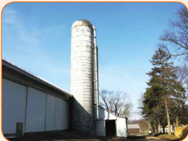
רפת אופיינית בארצות הברית שם בוחרים עגלות להעברה

הייתי מספר פעמים בארה"ב מטעם חברת DFI והחקלאית