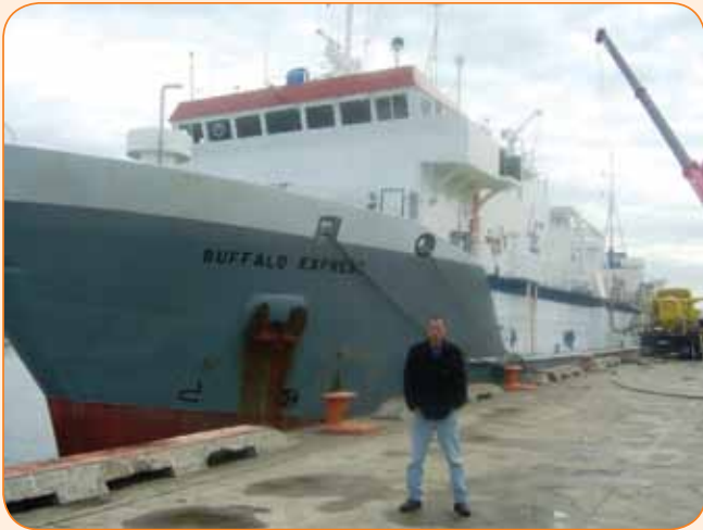
האנייה שמובילה את 520 העגלות במשך 21 יום