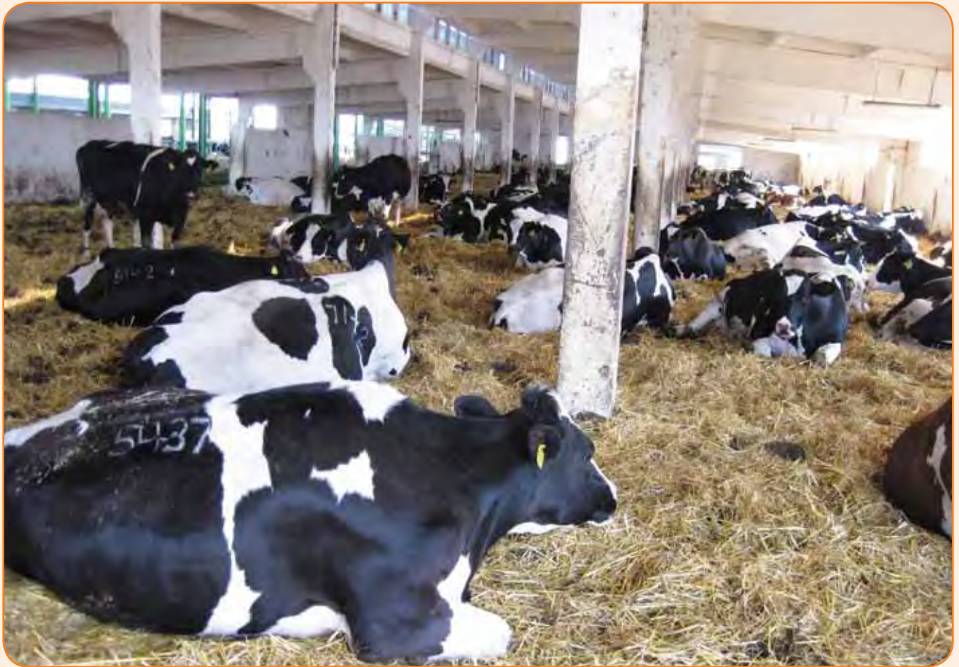
מבנים ישנים של החווה בצד החדשים

העגלים נמכרים בתוך חודש. התחלופה עומדת על 25%-30% בשנה והכול מגידול עצמי.