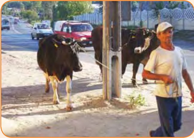
עדר מקומי קלסי ברומניה - פרות בודדות