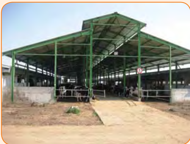
תכנון ישראלי של המבנים לפרות

החליבה מתבצעת במכון חליבה משוכלל מסוג פרלל שכולל 50 עמדות 2*25 וכן מכון טיפולי קטן עם 6 עמדות בעבור הפרות לאחר המלטה - קולוסטרום ופרות חולות שמתופלות בתרופות. פרה "משתחררת"