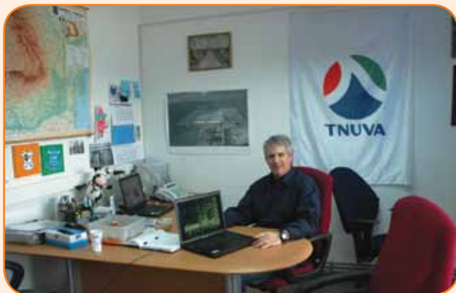
משרד החווה והרפת - הניהול הישראלי עבר לרומניה

החווה הוקמה בשנת 2006 כחלק מאסטרטגיה כוללת במערך ההקמה של תנובה רומניה - מחלבה שמייצרת מוצרי חלב לשוק הרומני (ויגורט, שמנת, קוטג', סנא - מוצר רומני טיפוסי, מעדני יופלה בטעמים, שוקו, פרפה - קפה קר, ועוד עשרות מוצרים) ורפת שמחד, מייצרת חלב גולמי איכותי למפעל ומאיידך, מהווה דוגמה לניהול מקצועי וטכנולוגי