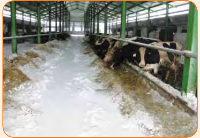
החורף קשה במיוחד עם טמפי' נמוכות מאוד וקשיי תפעול ניכרים