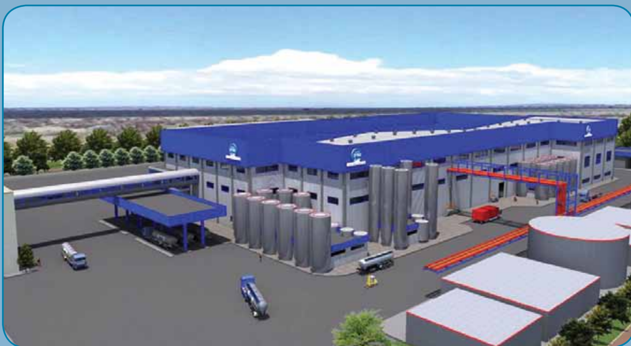
קבלת חלב מהירה ונוחה

מחלבת טרה מתכוונת לטפח את כל יצרניה ולא לוותר על אף יצרן, שכן היא רוצה לגדול ולהתפתח וזקוקה למגדלים נוספים.