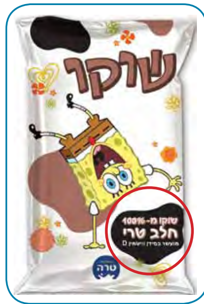
חלב טרי 100%

"חשוב שתהיה רזרבה של חלב, כולם רוצים להגדיל אבל בפועל, פוחדים לשחרר את המכסות. יש לחלק 5% תוספת מכסות ולשלם 80% מקדמה לחלב עודף א' עד 4% במטרה להשלים את החוסר הקיים באבקה ובחמאה. השנה היה מחסור בחלב, טרה קנתה עוד 15 מיליון ליטר ממחלבות אחרות וחסרים לה כ-5 מיליון ליטר נוספים - אני נלחם על כל ליטר".