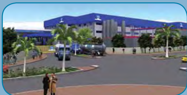
מחלבה מודרנית ומתחשבת בדרישות הסביבה

המחלבה החדשה מתוכננת להיבנות על שטח כולל של כ-85 דונם, בשלב הראשון תוכל לקלוט כמיליון ליטר ליום ותייצר את כל מגוון מוצריה באתר אחד.