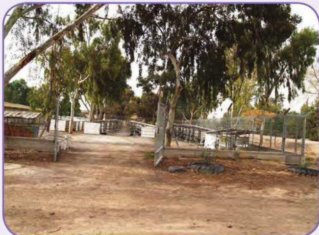
יונקייה ממוגנת בעקבות גל נגבות באזור