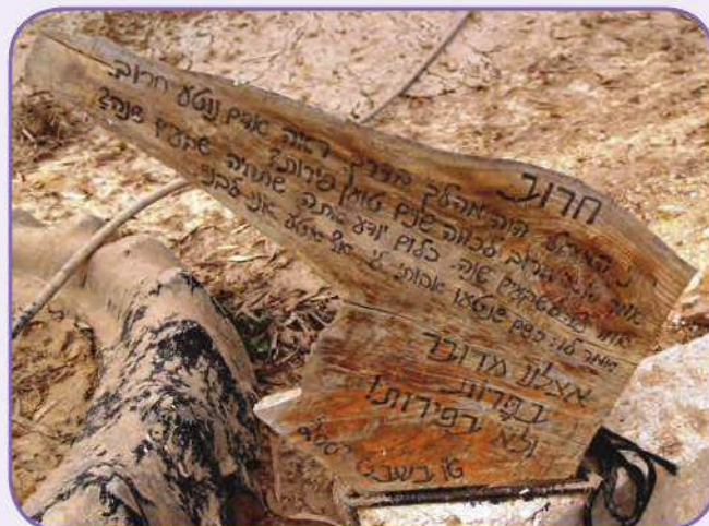
החרוב ב"שביל החלב"

הצוות מורכב מ-10 עובדים, 5 שכירים והשאר חברים - מתוכם 3 נשים - סילביה, סגניתה נעמה וציונה שעבדה ברפת בתיכון וכיום היא בשלב של עבודה מועדפת אחרי הצבא. הגברים הם: אל דומא, יחיא