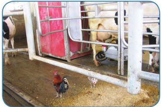
מענקים יפים לסייע ברכישת רובוט

מספרם של העובדים הזרים בחקלאות בישראל עלה בהתמדה מאז תחילת שנות ה-90. בשנת 2008 מכסת ההיתרים להעסקת עובדים זרים בחקלאות עמדה על 28,500; 2,500 ממכסת ההיתרים הייתה מיועדת לעידוד היצוא, והעובדים הזרים היו כ-32% מהמועסקים הקבועים בחקלאות.