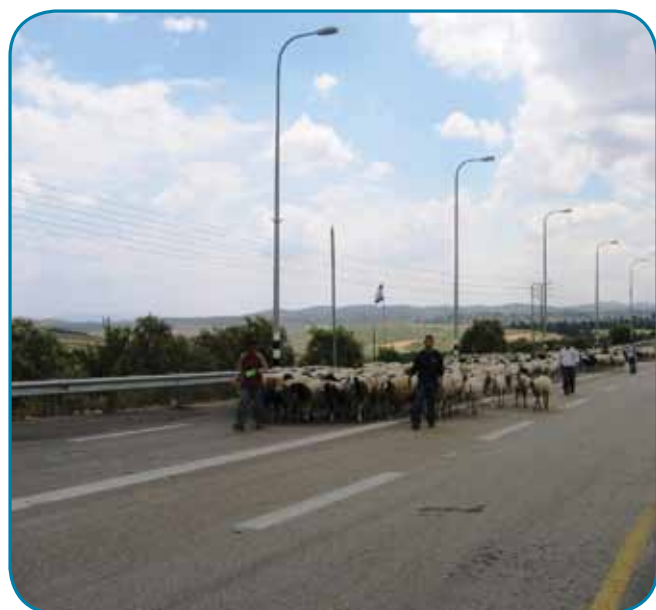
עדר כבשים יוצא למרעה ליד אליקים, בכביש שעולה לרמות מנשה

בענף הכבשים לחלב פעילים 62 יצרנים, החלב מהווה יותר מ-50%