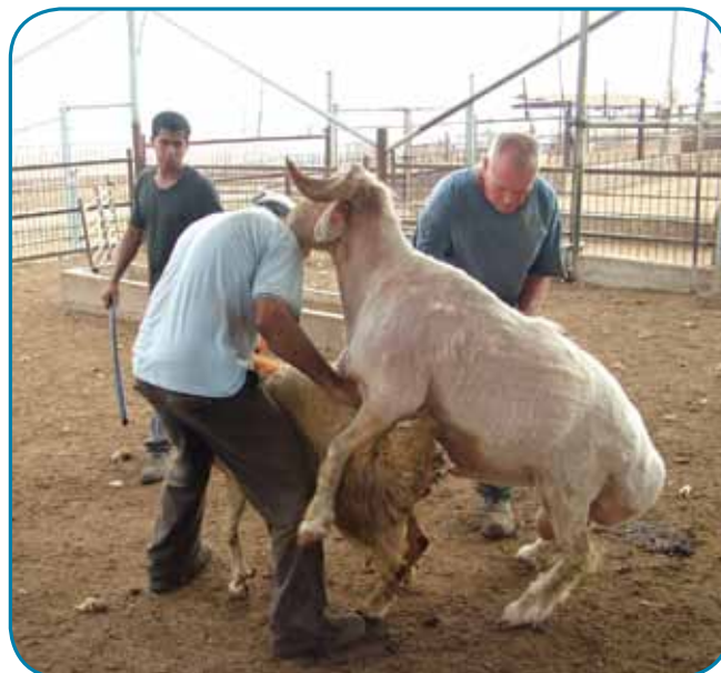
הרבעת כבשים בדיר עין חרוז איחוד

בשנת 2008, מחיר חלב כבשים היה 4.09 ש"ח ומפברואר ועד ספטמבר הגיע ל- 4.22 ₪ (הפחתה של 10 אג' בגין העונתיות) וברבעון האחרון של השנה (אוקטובר-דצמבר) מחיר חלב כבשים עלה ל-4.67 ₪ (תוספת של 35 אג' בגין האיזון בין עונות השנה). בשנת 2009, מחודש ינואר ועד יולי, מחיר חלב כבשים ירד ל-4.12 ₪