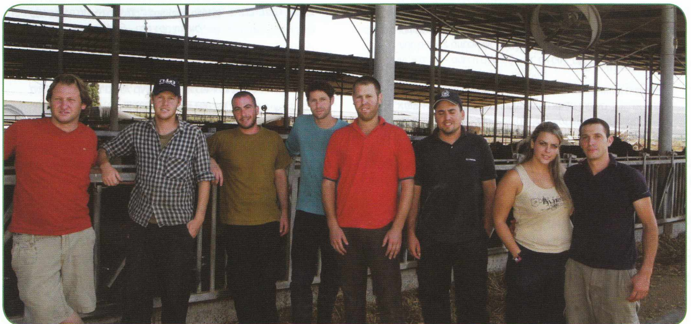
צעירי הרפת שרוצים מאוד להיות רפתנים עם מכסה עצמאית לפרנסה

ש גב סגלציק הוא צעיר שמנהל כיום את הרפת בבית הספר החקלאי בכדורי. נפגשתי איתו ברפת בעת שעשינו מוסף מיוחד על בתי הספר החקלאיים והתרשמתי מהאנרגיות ומהרצון העז שלו, להביא צעירים לרפת ולחנך אותם מגיל צעיר לעבודה עם בעלי חיים. הוא קרא ושמע על העיסוק של הענף בנושא דור המשך ברפת והזמין אותי לביקור במקום מגוריו בשרונה ולפגוש חבורה של צעירים, שרוצים מאוד להיות בנים ממשיכים ברפת ואין להם בקשות גדולות, מלבד