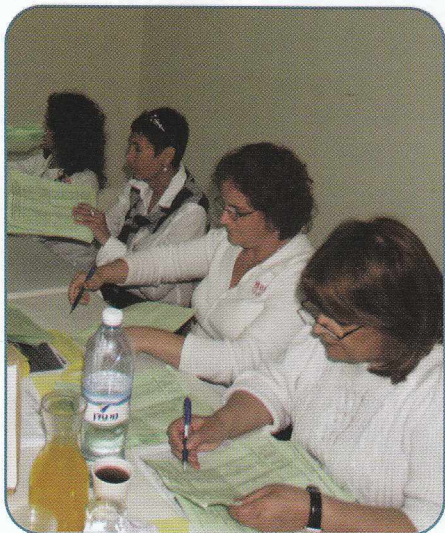
סופרים את הקולות ומרכזים את התוצאות