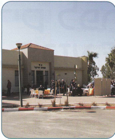
קבלת החברים נעשתה בכניסה לאולם הדקל החדש של מלון חפץ חיים

שלושת האגודות קיימו את האספה שלהן ביום אחד באולם הדקל במלון של קיבוץ חפץ חיים. לאחר כמה ימי גשם וסערה, מזג האוויר ביום האספה היה מקסים ועזר להוציא את החברים החוצה, לשמש.