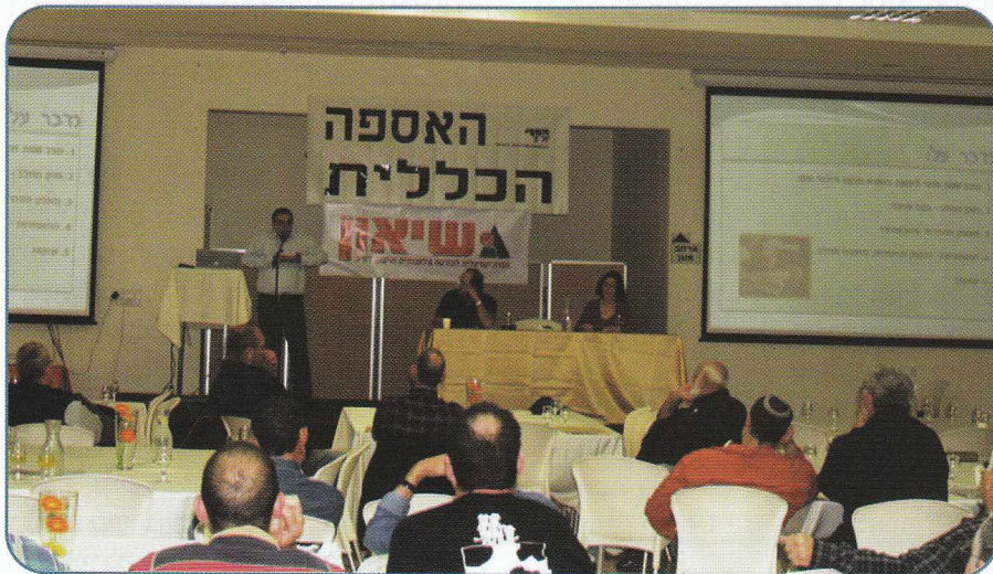
האולם היה מלא והדריכות להחלטות ההתאחדות הייתה רבה

לפניכך כמה תמונות מדגם שמייצגות את מה שהיה ביום שלישי של שלוש אספות רפתנים