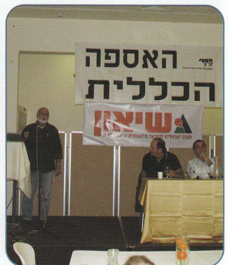
באספת ההתאחדות היו חברים שהביעו את דעתם על עניינים ארגוניים