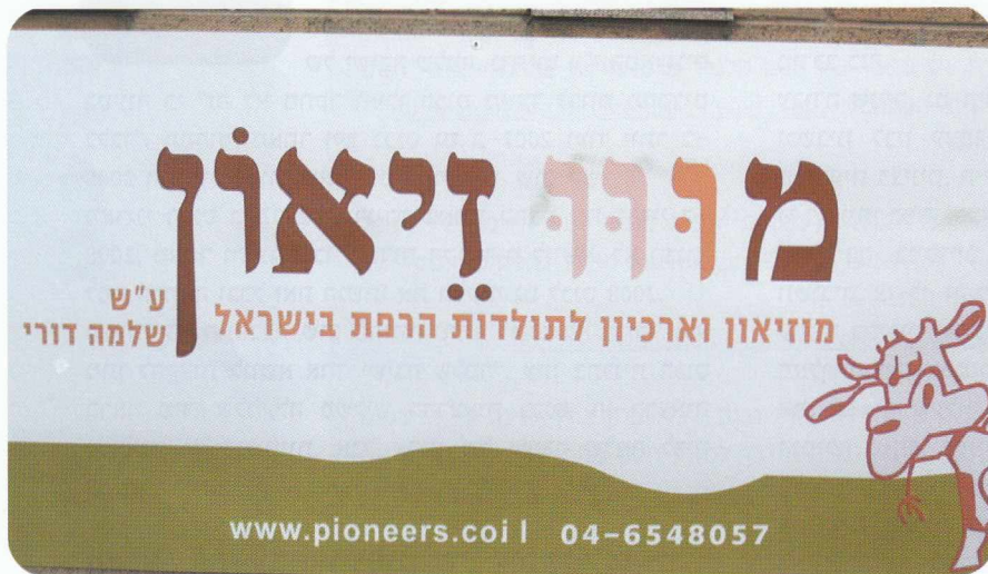
עוצב סמל חדש למוזיאון

לדאבוני, ביקורים של קבוצות הולכים ומתמעטים עם השנים, והסיבות לכך: א. המוצגים במוזיאון קבועים ולכן אדם,