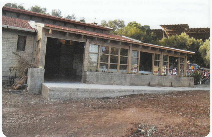
החזית החדשה של המוזיאון שנקרא על שמו של שלמה דורי ז"ל