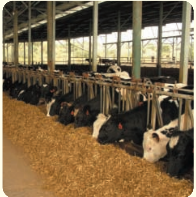
בליל מזון ברפת רגבים