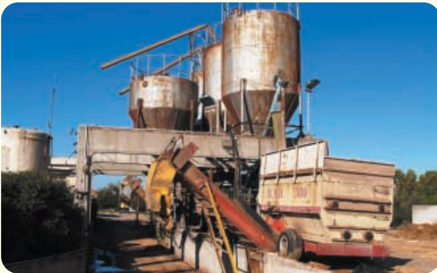
המרכז משרת בעיקר את רפתני המושב