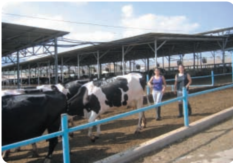
מגע מתחשב עם הפרות