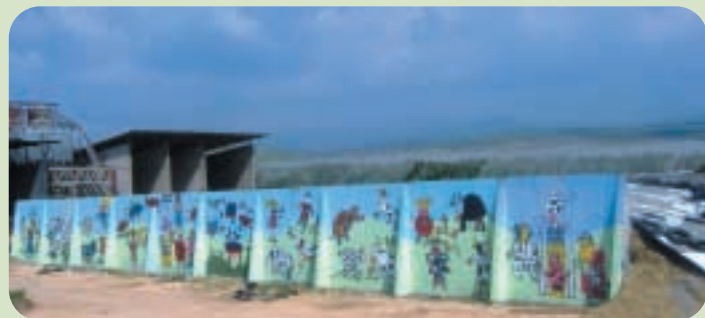
בור תחמיץ ברפת גנוסר