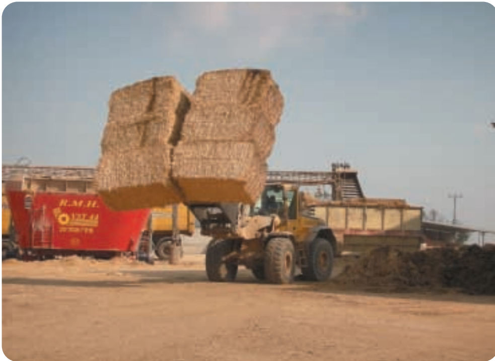
אמצעי בטיחות ברפת יחסכו פגיעה בנפש