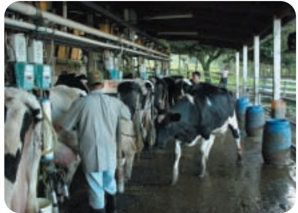
חליבת פרות באמריקה הלטינית

נמוכים באופן יציב בשנים האחרונות ולמעשה, עד סוף 2006. בין השנים 1990 ל-2006, נעו מחירי אבקות החלב (רזה ומלא) בין 1,100 ל-2,300 דולר לטון ומחיר החמאה נע בין 1,000 ל-2,500 דולר לטון. החל מתחילת 2007 חל שינוי משמעותי במחיר הבין-לאומי של כל חומרי הגלם החלביים. מחירם הגיע לשיא בחודש אוגוסט האחרון ומאז הוא במגמת התייצבות (באבקת החלב המלא) או, אף ירידה מתונה (באבקת החלב הרזה), כפי שניתן לראות בשני הציורים הבאים שמתארים את מגמת מחירי אבקות החלב בשוק העולמי (הנתונים מוצגים ביוור לטון ומעודכנים לחודש ספטמבר).