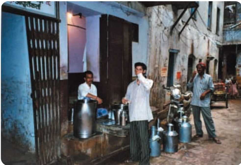
מסוור חלב בהודו