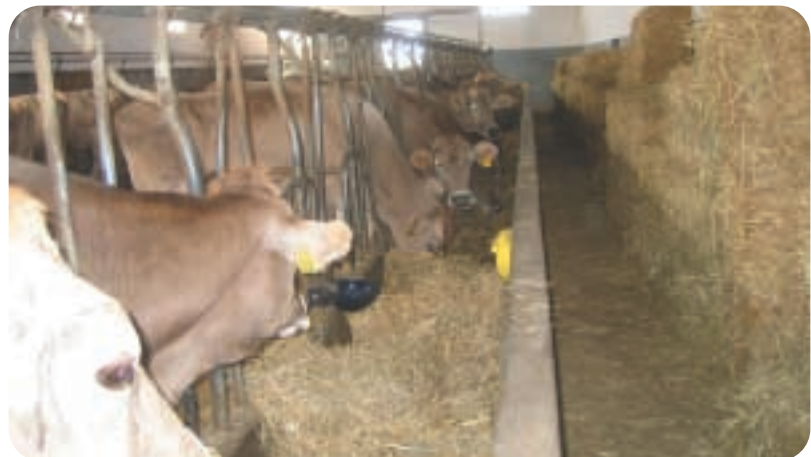
ייצור חלב באיטליה

המצב הנתון יוביל ככל הנראה לשינוי דפוסי הייצור במדינות רבות. המדינות המייצרות בזול, בעיקר על בסיס מרעה, עשויות לנצל את חלון ההזדמנויות ולהגדיל את הייצור. מדינות העולם השלישי לעומת זאת, יעשו מאמצים רבים לפתח ולהגדיל את הייצור המקומי, במטרה לצמצם את ייבוא החלב שהתייקר כל כך. ברחבי