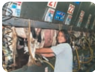
לייצר את כל מכסת החלב

ב. בשיטת מאזן "מקורות ושימושים", שבאמצעותה מודדים את סך מקורות