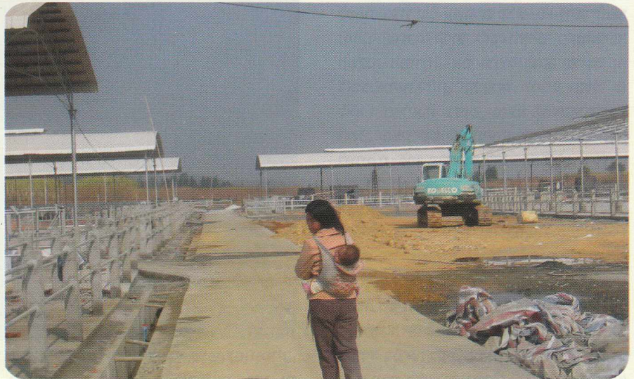
בזמן הבנייה של רפת ההדגמה

ייצור החלב בסין עולה גם הוא בהתמדה ומנסה להדביק את העלייה בביקוש. המאמצים להגדיל את הייצור מתאפיינים בהגדלת מספר הפרות החולבות והגדלת התנובה לפרה. ייצור החלב בסין עמד על כשישה מיליארד ליטר בשנת 1995 (1% מהייצור העולמי) והגיע ל-34 מיליארד ליטר בשנת 2006 (5% מהייצור העולמי).