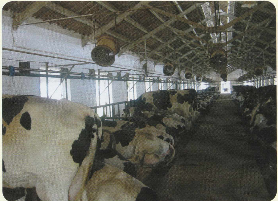
תאי רביעה ברפת "מצוננת"

המצב המתואר עשוי להיות גם "חלון הזדמנויות" לענף החלב הישראלי. מחד, מחירים גבוהים לאבקות החלב בשוק הבין-לאומי עשויים לשפר את מעמדו של הענף מול יבוא מתחרה ואף עשויים להגדיל את הסיכויים לייצוא חלב מישראל. מאידך, המוניטין של ענף החלב בישראל שמתבסס על הישגי הענף בייצור בתנאים הקשים של אזורנו, עשוי להגדיל את הסיכויים לייצוא טכנולוגיות ייצור מתקדמות וידע ישראלי לאזורים, שבהם עשויים להתפתח משקי החלב בעתיד. ■