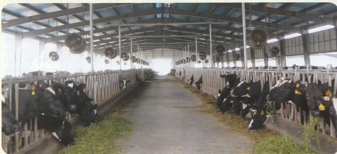
פנים הסככה ברפת ההדגמה הישראלית

ממשלת סין מסבסדת פרויקט של "חלב לבתי ספר", שמקיף כשלוש מאות מיליון תלמידים, והכולל היקף חלב