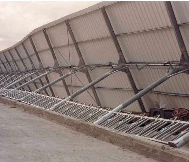
2. סככה רובצת

בא רפתן אחרי רוח הומה ואבוי לבושה נשאר מהומה