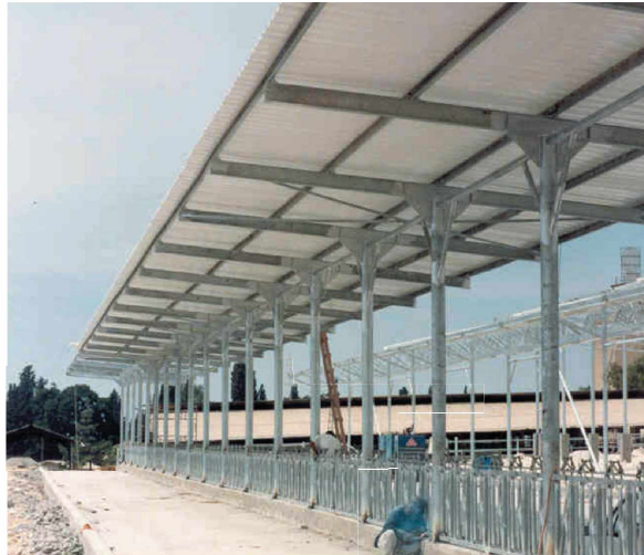
1. סככה עומדת

תוכננה סככה נבנתה והושלמה כוסתה לוחות פלרם לתפארה להגן על אבוס מגשמים וחמה