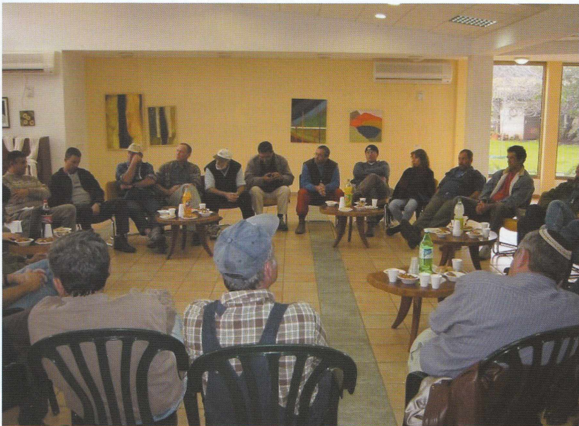
כנס רפתנים בגבעת יואב - רמת הגולן

במהלך השנים, חלו שינויים מפליגים בהתיישבות - פרוק האגודות במושבים, הקטנה משמעותית של מספר היצרנים המשפחתיים וחלקם היחסי ביישוב, שותפויות בשני המגזרים וגם הורדת הערך של הערבות ההדדית, כל אלה הובילו למחשבה נוספת