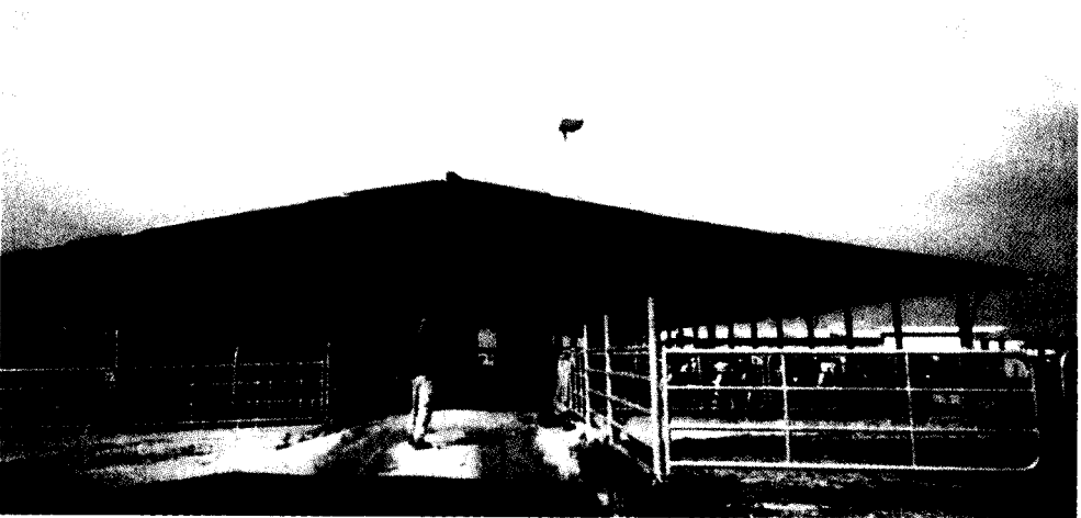
מבנה רפת עם תאי רביצה (בעבר) משמש עתה לגידול עגלות.