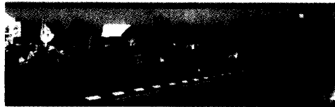
הפגנה של יצרני החלב ביום 10.4.03, תיעוד למצולם עד סוף החוברת הזאת.