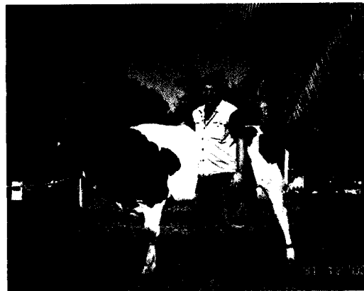
אדו ממסילות עם פנקייק 7432.