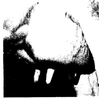
העטין של פנקייק 7432, בתחלובה 2.