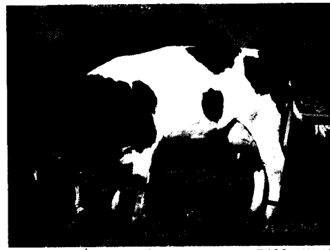
פנקייק 7432, בת דנדן אסיעם (רפת מסילות)