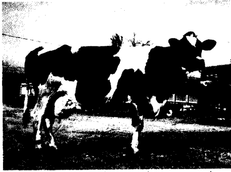
היאלי 998, אחות למחצה של דנדן (משק מלצר, כפר ידידיה)