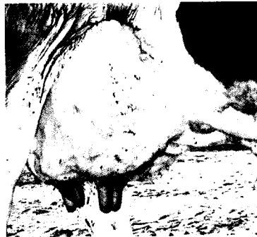
העטין של היאלי 998 בתחלובה 6.