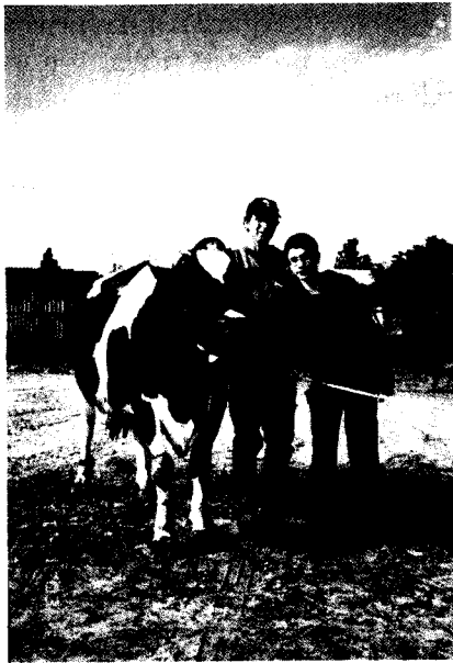
ותיק וצעיר (משק מלצר, כפר ידידיה)