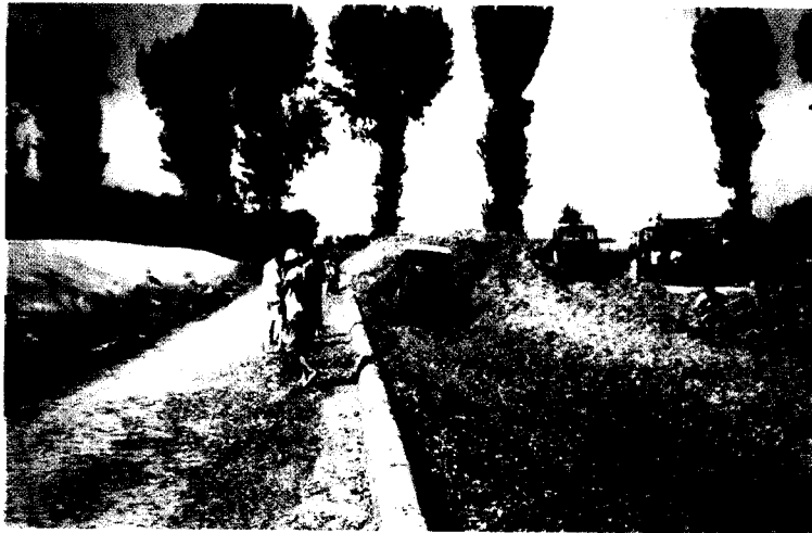
הכנת תחמיץ ברביעם + טרקטורים, בסין.

תחמיץ מהדקים בכלי כבד, את זה כולם יודעים. מהו הכלי הכבד? טרקטור זחל כמובן. ההגיון של חלוקת המשקל לנקודה קטנה אחת בטרקטור גלגלים קשה להבנה. הכנת תחמיץ בסין כבתמונה המצורפת בטרקטור זחל והרבה