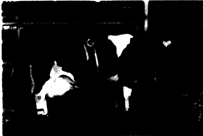
אכן, פרה נאה בהחלט. נתוני השיפוט הגופני שלה בגיל 15: