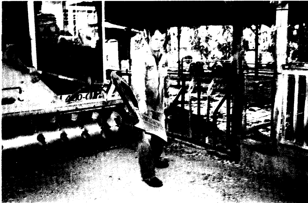
מורידים המתקן לקראת קירוב שאריות מזון, בטרם חלוקת מנה חדשה.