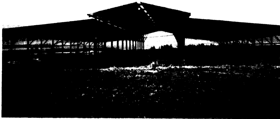
הסככה החדשה במשק גלבוע, מושב כפר יחזקאל המתוכננת לאכלס 160 פרות. לקראת ההרחבה נבנה גם מכון חליבה חדש, ועוד פרטים מעניינים לרוב.

בסיכום, למרכזי מזון המשווק שנתית (בישראל) 27 מיליון ק"ג חלב, ס"ה 11 עובדים. בהנחה שמשק משפחתי ממוצע יגיע ויכול להגיע למכסה של כ-800,000 ק"ג חלב, מדובר בסך כולל של כ-34 יחידות משק שהם לפי כ-1.4 עובדים למשק (אב ובן, למשל) זה הקף של כ-48 עובדים. סך כל העובדים 59. זה טוב ויעיל אפילו יותר מהרפת הגדולה בדגם האמריקאי. היום כאשר המכסה עדיין בהקף של כ-400,000-450,000 ק"ג, היעילות שלנו במשק המשפחתי נראית נמוכה יותר, אבל זה אינו מדויק מאחר שבמרבית המשקים המשפחתיים אצלנו יש גם ענפים ומקורות