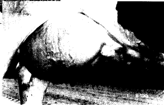
העטין של בול 4833, עטין אופייני לבנות מסול.