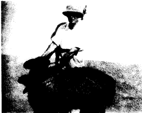
דר' ה. פוקס עם כבשת קראקול בחוות עכו.

בפרוץ מלחמת העולם השנייה, בשנת 1939 עזב דר' פוקס את הארץ וחזר לאנגליה. ההנחה המקובלת היתה, שהוא התגייס לצבא הבריטי. מאחר שעקבותיו נעלמו בהמשך הזמן, התפתחה השערה שהוא נפל באחת החזיתות. לפני מספר חודשים מצאו אורי ואלה ברגיא