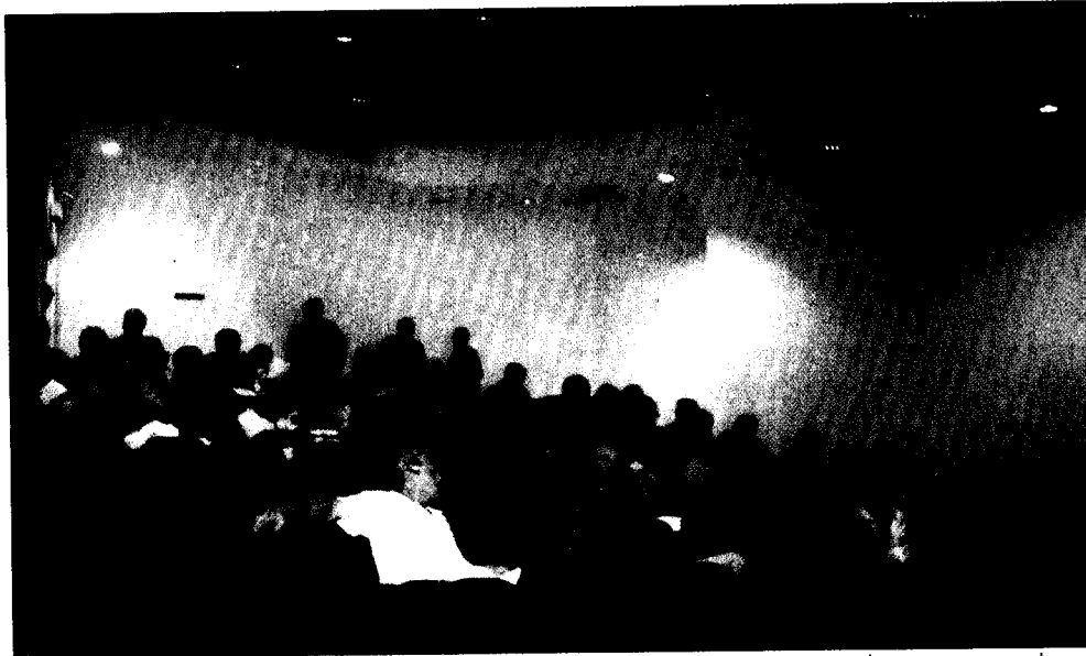
הקהל בעת הדיון בהחלטות.